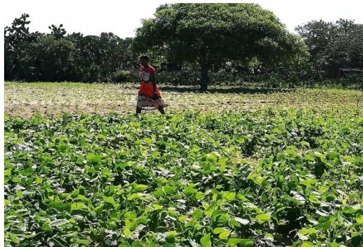
Distribution de semence