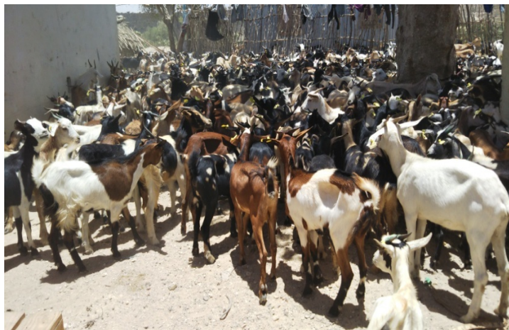
Distribution des chèvres ou moutons