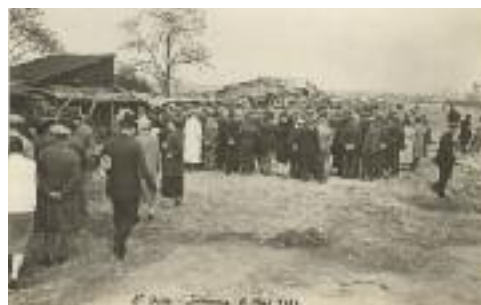
Évangélisation en plein air, St Ouen, 8 mai 1927

Votre livre s'intitule Évangéliser en France au XX e siècle, Histoire de La Cause 1920-2020. Or, je suppose que pour beau-