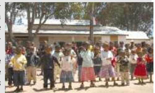
Pour tous ces enfants...