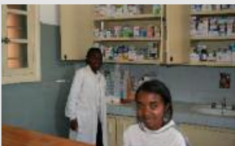
À l'infirmerie d'Avotra...