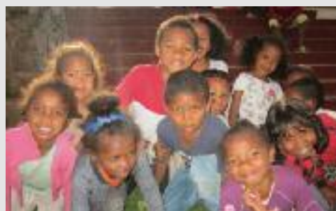
Veiller au soin des plus petits...